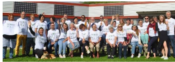
Séminaire de INFORSE-Europe au Nordic Folkecenter for Renewable Energy, 2022.